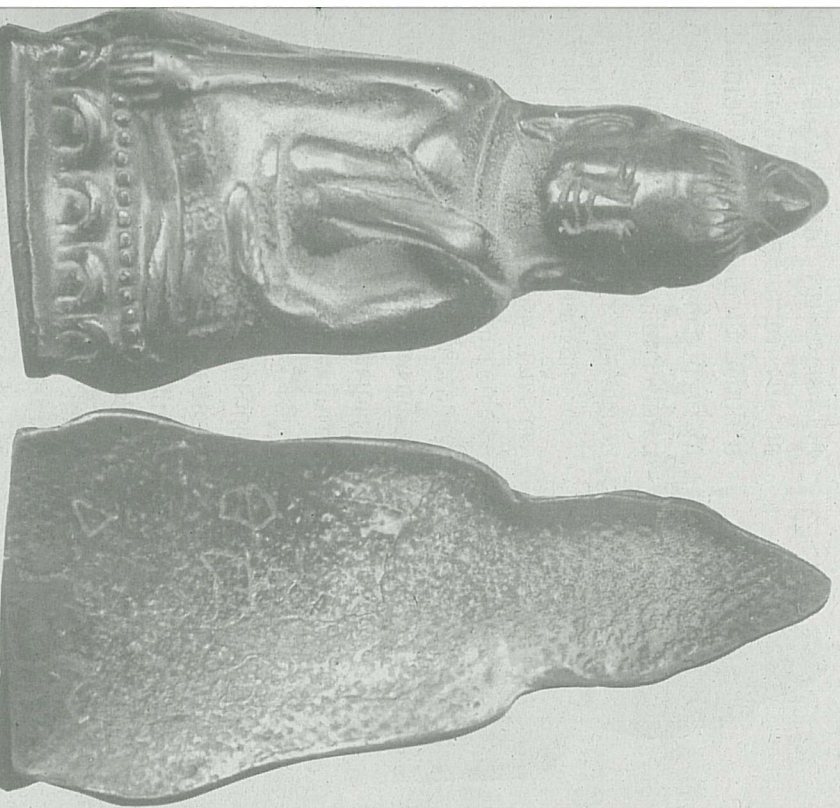
พระหูยานเนื้อเมฆพัตร์ พิมพ์ใหญ่

อ.ชาผง จ.กาญจนบุรี มีสื่อทางมิมิตเข้าสู่แหล่งผลิตสัมผัส ได้เห็นแร่ธาตุกายสิทธิ์ให้เห็นมากมาย จึงตั้งใจตออิฐฐานขอให้ปรากฏทางมิมิตอีก และเหตุการณ์ดังกล่าวก็ปรากฏให้เห็นทางมิมิตอีกหลายครั้ง ท่านจึงตั้งใจ หากมีโอกาสและวาสนาปรากฏต่อไปในภายภาคหน้า จะขอสร้างวัตถุมงคลที่มีลักษณะที่สื่อทางมิมิตขึ้นมา