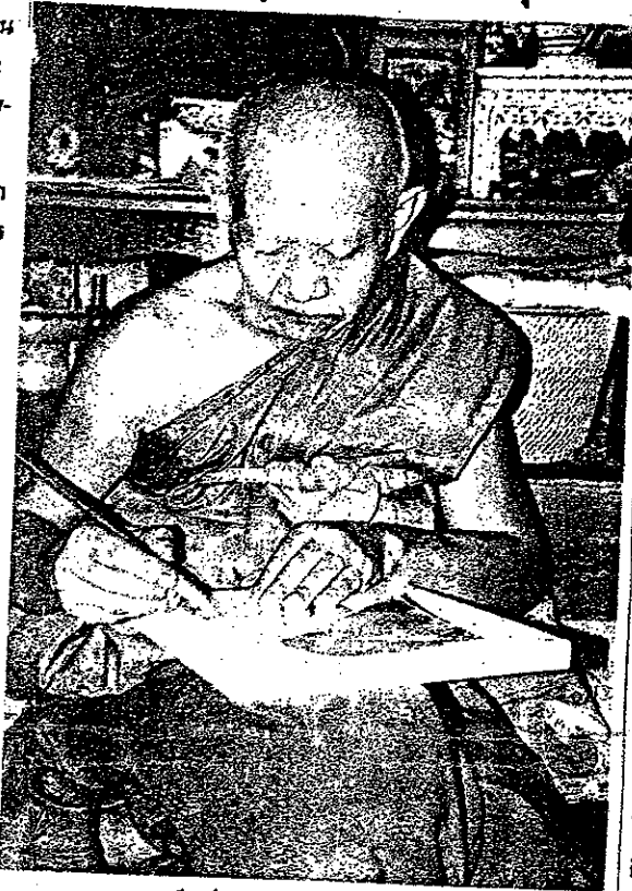
หลวงปู่หงษ์ พรหมปัญโญ ปัจจุบันมีอายุ 76 ปี

วัดเพชรบุรี ต.ทุ่งมน อ.ปราสาท จ.สุรินทร์