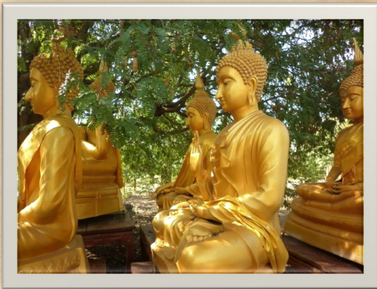
ภาพที่1 : พระพุทธเจ้าทั้ง 5 พระองค์ค่ะ

ขอเชิญผู้มีจิตศรัทธาร่วมสร้างศาลา เพื่อประดิษฐาน พระพุทธเจ้าทั้ง 5 พระองค์ และ ฐานรองพระปางเปิดโลก ที่ สำนัก สงฆ์วัดป่าเทพนิมิต ด. โป่งนก อ.เทพสถิตย์ จ.ชัยภูมิ ค่ะ