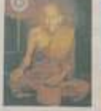
พระพุทธรูป ขนาด ๑.๕ ซม. สูง ๑.๕ ซม. สังกัดชาโหล่ง