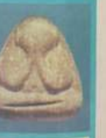
สัมฤทธิ์ชาโหล่ง ขนาด ๑.๕ ซม. สูง ๑.๕ ซม. สังกัดชาโหล่ง