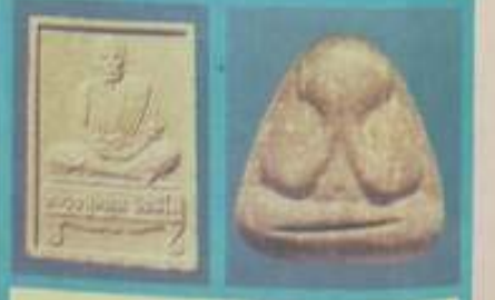
สัมฤทธิ์ชาโหล่ง ขนาด ๑.๕ ซม. สูง ๑.๕ ซม. สังกัดชาโหล่ง

บูชาได้เลย! พระกริ่งหลวงโศก, พระกริ่งนาคปรก 108 ขนาดหน้ากว้าง ๑.๕ ซม. สูง ๑.๕ ซม. ราคา ๑๑๑ บาท พระพุทธรูปเขียนสม กษัตริย์ ๕ นิ้ว ๑๑๑ บาท (หน้า ๑.๕ ซม. สูง ๑.๕ ซม.)