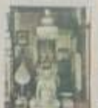
พระพุทธรูป ขนาด ๑.๕ ซม. สูง ๑.๕ ซม. สังกัดชาโหล่ง