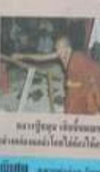
พระพุทธรูป ขนาด ๑.๕ ซม. สูง ๑.๕ ซม. สังกัดชาโหล่ง