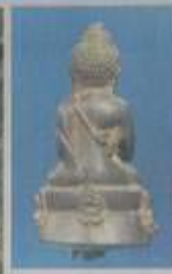
สัมฤทธิ์หลวงพระบาง ชาโหล่ง สังกัดชาโหล่ง