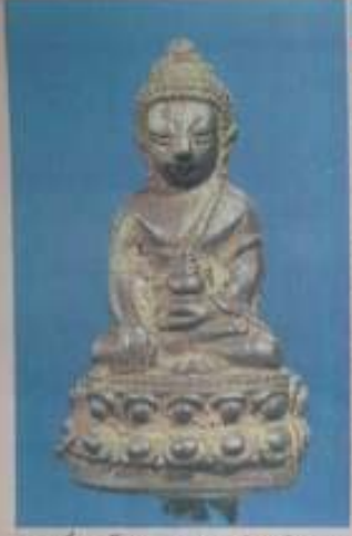
พระกริ่งหลวงโศก นามสกุล รุ่นเจริญสาภ ซึ่งมีเนื้อสัมฤทธิ์ที่วัดดุนงคกรุ่นแรก ตั้งแต่ประมาณ ๒๑๑ ปีที่แล้ว พระกริ่งนี้ทำพิธีพุทธ เจ้าเป็นอันมาก และได้รับยกย่องจากพี่น้องผู้ศรัทธา เมื่อพุทธชนสมัยที่สี่คือ

แนะนำงานศิลปะเหล่านี้เป็นอาจารย์ผู้ทำ โดย คุณ วีระพงษ์ แซ่เต๋อ โครงการงาน โทษีหิชา