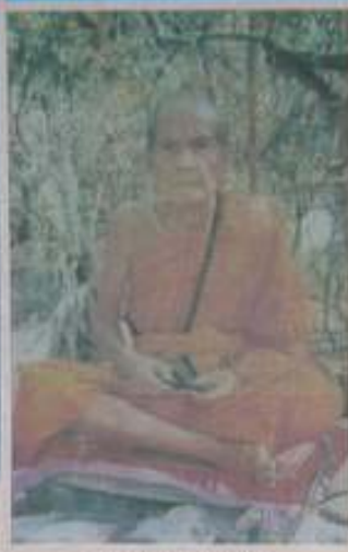
หลวงปู่หมื่น ฐิตสีโล อายุ 105 ปี พรรษาที่ 83