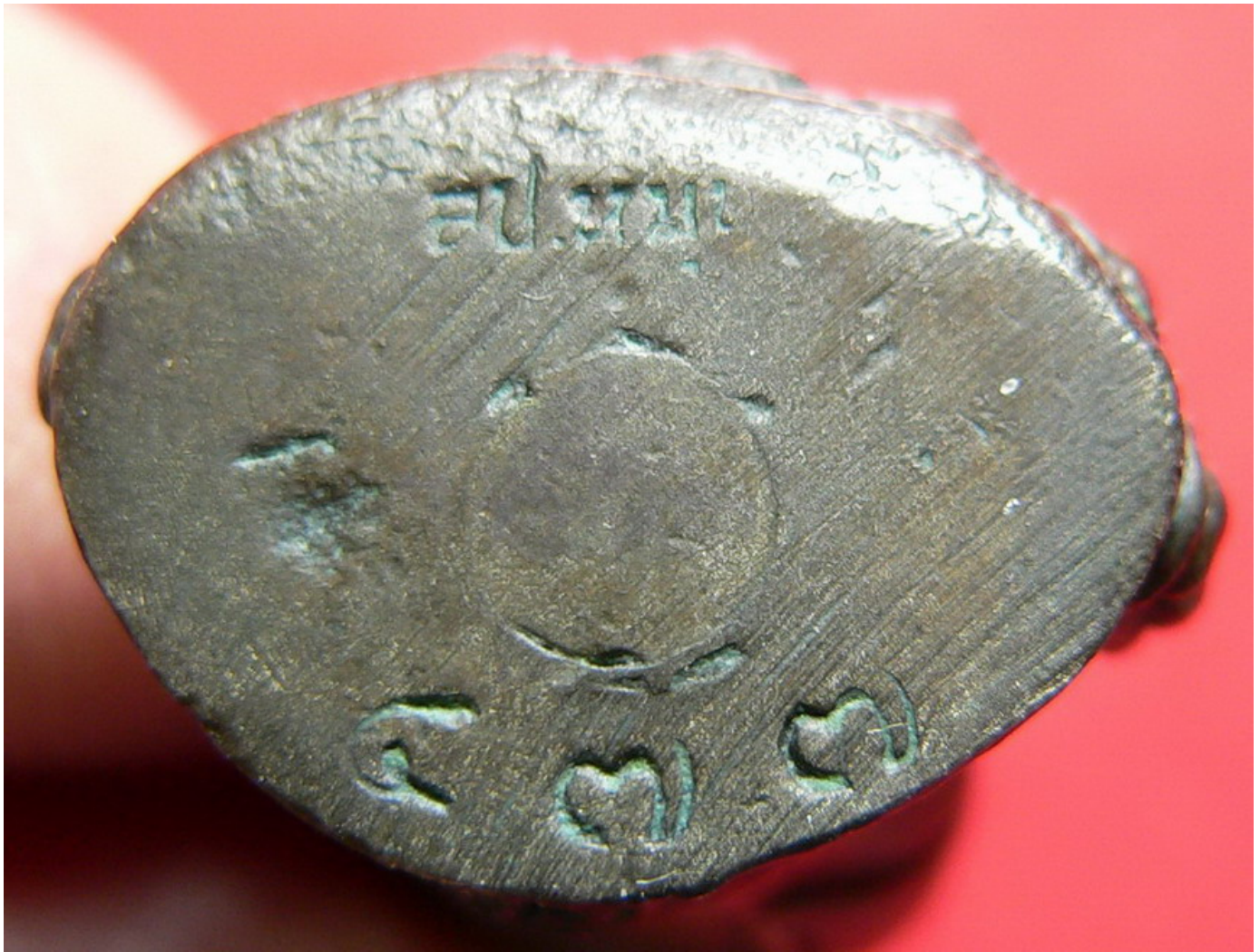
หลวงปู่เมตตาชั้ยยันต์(เขียนยันต์)กลางอากาศให้แล้วนำมาลงสู่ปลายปากกาเมจิกให้ครับ