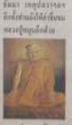
พระพุทธรูป ขนาด ๑.๕ ซม. สูง ๑.๕ ซม. สังกัดชาโหล่ง