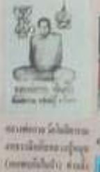
พระพุทธรูป ขนาด ๑.๕ ซม. สูง ๑.๕ ซม. สังกัดชาโหล่ง