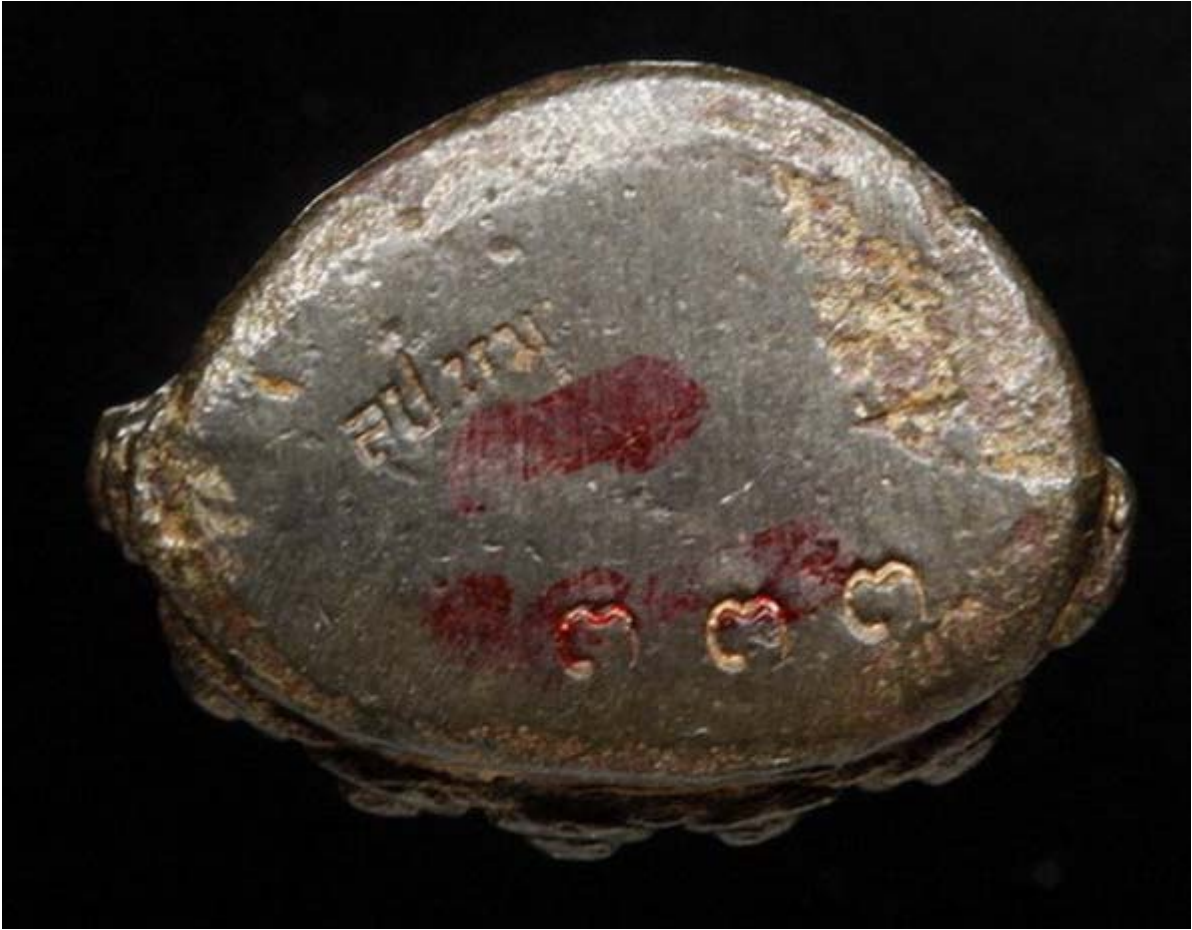
พระกริ่งเจริญตากบเบอร์เก้าครึ่งผม