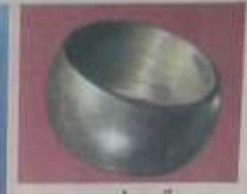
พระวงล้อกลิ้ง ส่วจากพระกริ่งชาโหล่ง มีขนาดกว้าง ๑ ซม. สูง ๑.๕ ซม. สังกัดชาโหล่ง ชาโหล่ง สังกัดชาโหล่ง