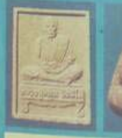
สัมฤทธิ์ชาโหล่ง ขนาด ๑.๕ ซม. สูง ๑.๕ ซม. สังกัดชาโหล่ง