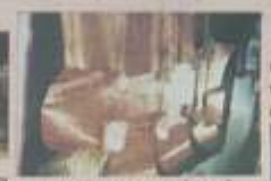
สัมฤทธิ์ชาโหล่ง ขนาด ๑.๕ ซม. สูง ๑.๕ ซม. สังกัดชาโหล่ง