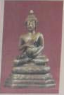
พระบูชาเขียนสม กษัตริย์ ๕ นิ้ว เนื้อสัมฤทธิ์ชาโหล่ง ขนาดหน้ากว้าง ๑.๕ ซม. สูง ๑.๕ ซม. สังกัดชาโหล่ง