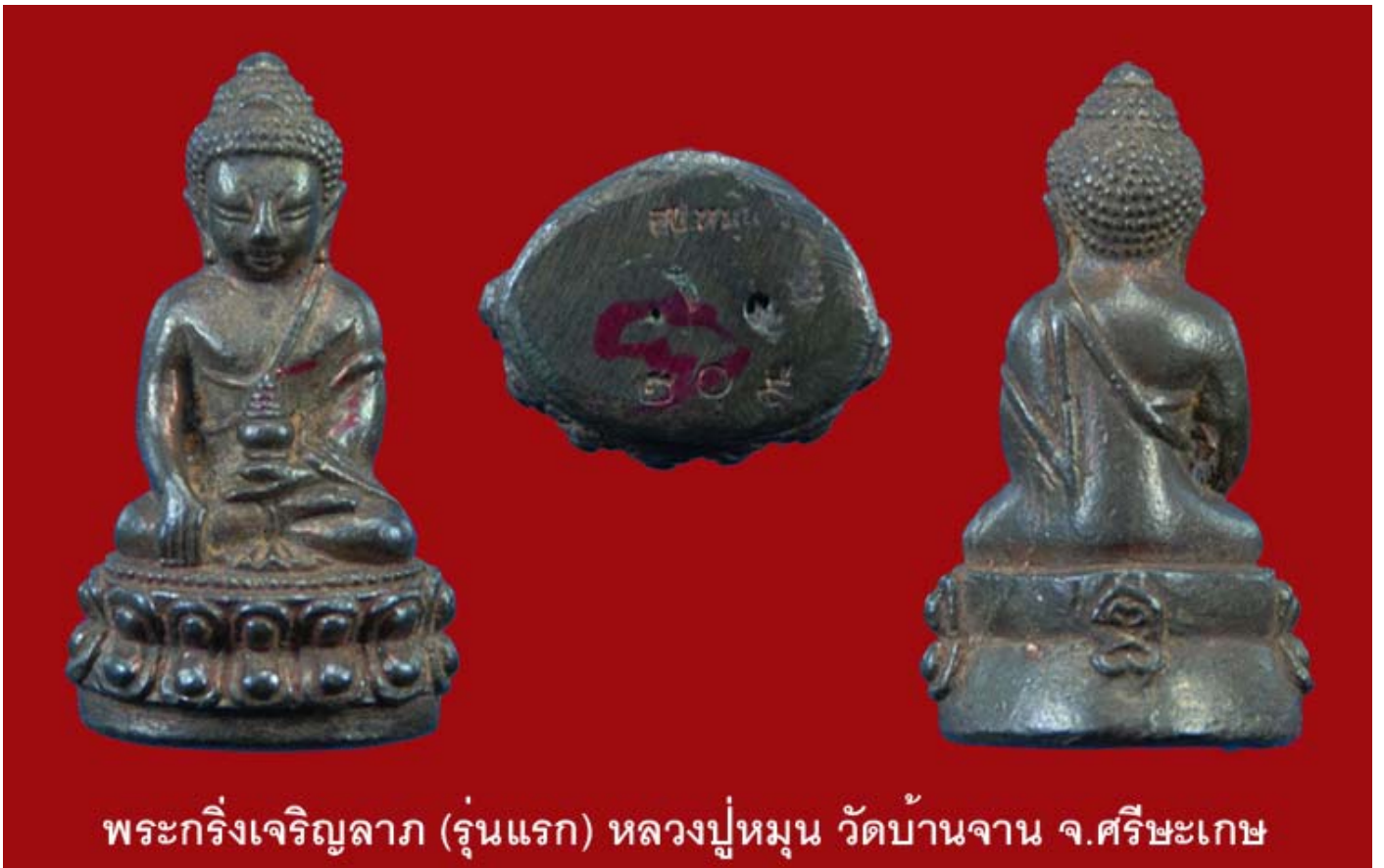
พระกริ่งเจริญลาภ (รุ่นแรก) หลวงปู่หมื่น วัดบ้านจ่าน จ.ศรีสะเกษ