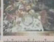
สัมฤทธิ์หลวงพระบาง ชาโหล่ง สังกัดชาโหล่ง