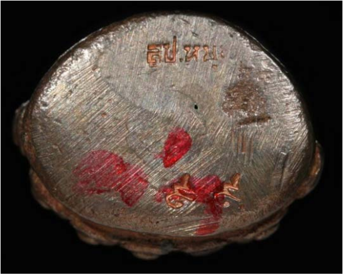
พระกริ่งเจริญลาภเบอร์เก้า-เก้า-เก้ารับผม