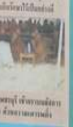
พระพุทธรูป ขนาด ๑.๕ ซม. สูง ๑.๕ ซม. สังกัดชาโหล่ง